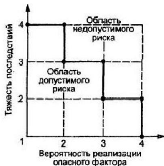
Таблица анализов риска при приготовлении и потреблении блюд.